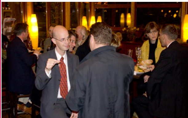
Anregende Gespräche nach Feierabend. Der ASU/BJU-Stammtisch hat sich im Laufe des vergangenen Jahres als feste Größe im Verbandskalender etabliert. Hier ein Foto vom November-Stammtisch im Park Café am Fehrbelliner Platz

Immer am ersten Mittwoch des Monats treffen sich Mitglieder von ASU und BJU Berlin im Parkcafé am Fehrbelliner Platz zum Stammtisch. In lockerer Atmosphäre, ohne Tagesordnung und in wechselnder Besetzung stehen angeregte Gespräche im Mittelpunkt. Auch für Neumitglieder oder Interessenten ist der Stammtisch eine gute Möglichkeit, die Verbände kennen zu lernen und Kontakte zu knüpfen. Nächster Stammtisch: 3.1.2007